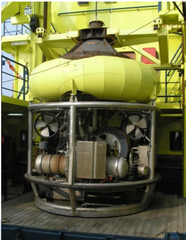
Tabel 1. Te gebruiken technieken bij verschillende methoden. NB geen uitputtende opsomming.

Foto: Remote Operated Hoisting Platform (ROHP). Deze ROHP is een type ROV dat door een opening in het vlak van het schip (de moon pool) te water wordt gelaten en door middel van kabels aan het onderzoeksschip is verbonden. Via het positioneringssysteem van het schip werd de ROHP op positie gebracht. De ROHP is uitgerust met een sectorscanner, akoestische camera en diverse videocamera's.