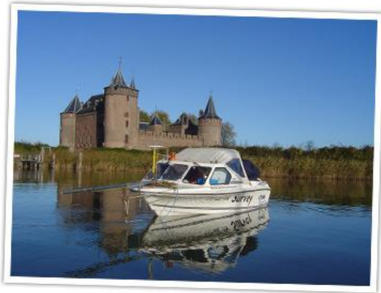
Foto: IVO-Opwater side scan sonar onderzoek. Over het algemeen wordt side scan sonar gebruikt voor het opsporen van fenomenen, en wordt multibeam echoloding gebruikt voor het nauwkeurig in beeld brengen van fenomenen, ofwel de mogelijke archeologische waarde.